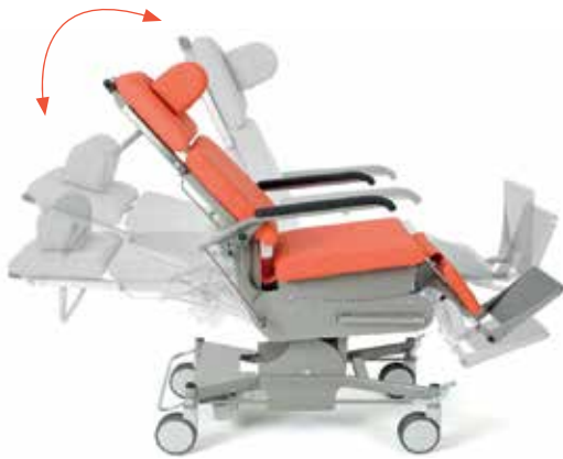
Höhenverstellung in jede Sitz- und Liegeposition