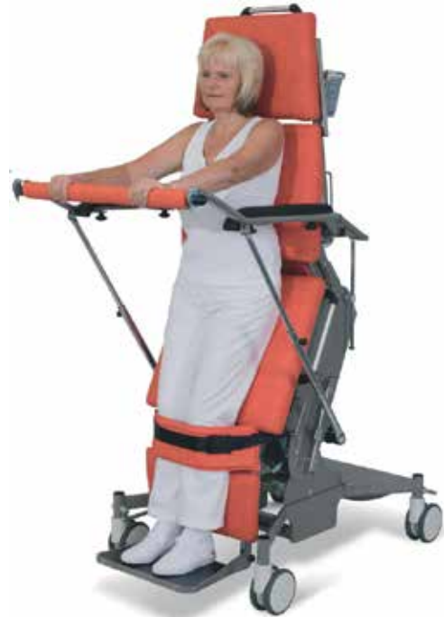
Abbildung mit Zusatzausstattung